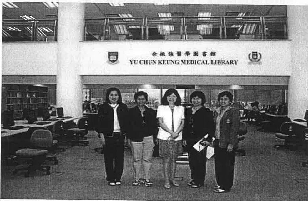
Dragon - HKD Library Online Catalogue : ฐานข้อมูลห้องสมุดและสืบค้นได้เป็น 2 ระบบ คือ Western